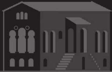
Santa María del Naranco