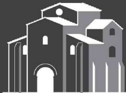
San Miguel de Lillo