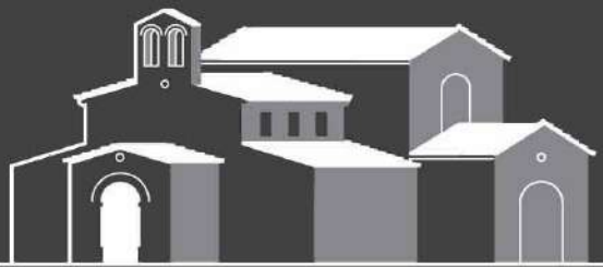
San Julián de los Prados