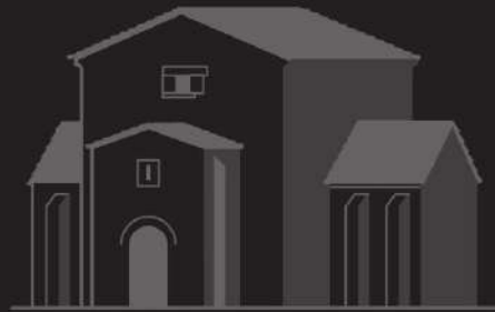
Santa Cristina de Lena