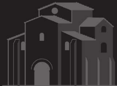
San Miguel de Lillo