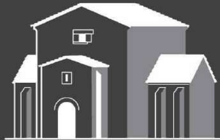
Santa Cristina de Lena