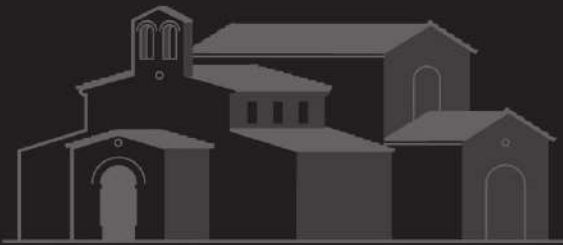
San Julián de los Prados